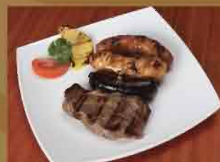
Tabla Chacal Sport Completa $ 14,90 $ 16,69

Chorizo macerado en vino, una olma de ternera, una morcilla y una jugosa carne de la casa.